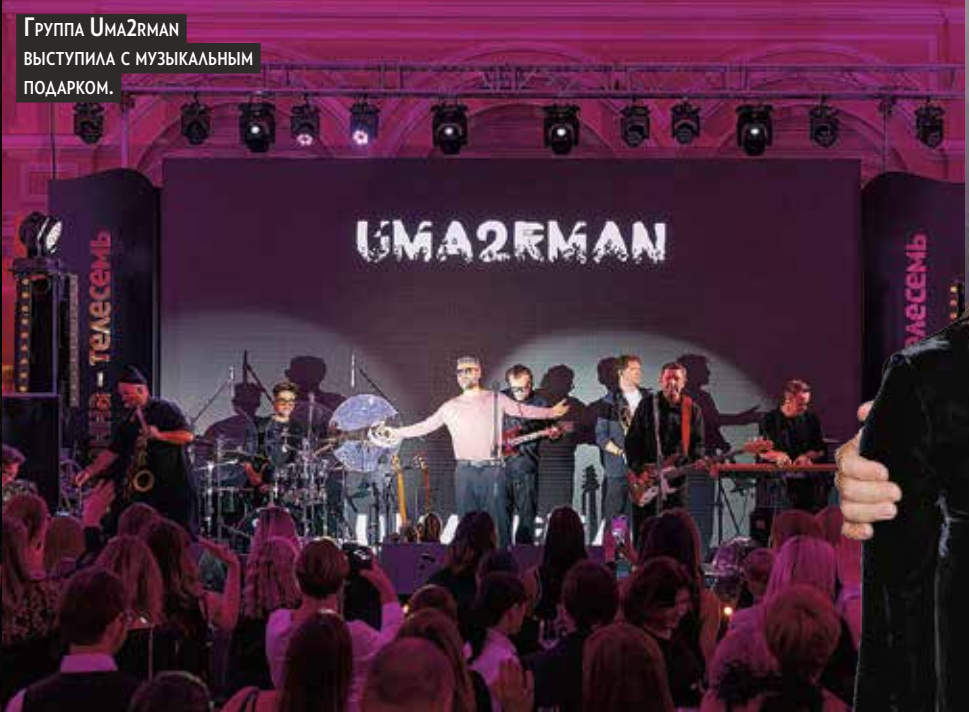
ГРУППА УМА2ЕМАН ВЫСТУПИЛА С МУЗЫКАЛЬНЫМ ПОДАРОМ.