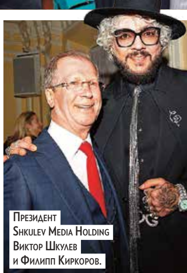
ПРЕЗИДЕНТ SHKULEV MEDIA HOLDING ВИКТОР ШКУЛЕВ И ФИЛИПП КИРКОРОВ.

На юбилей телегига пришли звездные гости.