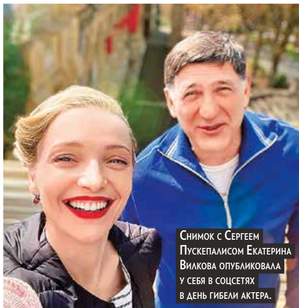
СНИМОК С СЕРГЕЕМ ПУСКЕПАЛИСОМ ЕКАТЕРИНА ВИЛКОВА ОПУБЛИКОВАЛА У СЕБЯ В СОЦСЕТЯХ В ДЕНЬ ГИБЕЛИ АКТЕРА.