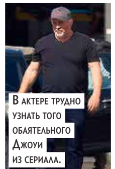
В актере трудно узнать того обаятельного Джои из сериала.

Звезда сериала «Друзья» 57-летний Мэтт Леблан впервые за несколько месяцев появился на публике и огорчил фанатов, поскольку сильно располнел и выглядел неряшливо для публичного человека. Леблан в последние годы практически не снимается, из-за чего впал в депрессию.