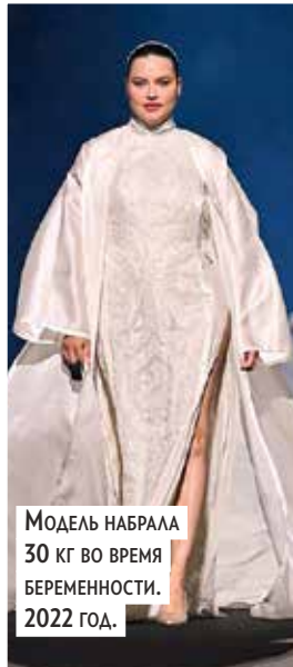
Модель набрала 30 кг во время беременности. 2022 год.