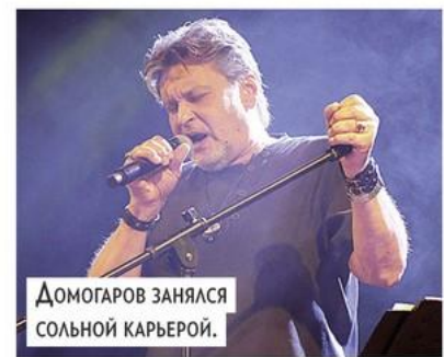
Домогаров занялся сольной карьерой.

атре будете работать?» – спросили у него зрители. «Ни в каком. Я свободный художник», – ответил актер.