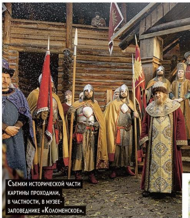
Съемки исторической части картины проходили, в частности, в музее-заповеднике «Коломенское».

В фильме «Стальное сердце» Никита Ефремов и Владимир Любимцев предстали в образах фольклорных героев, которые дожили до наших дней.