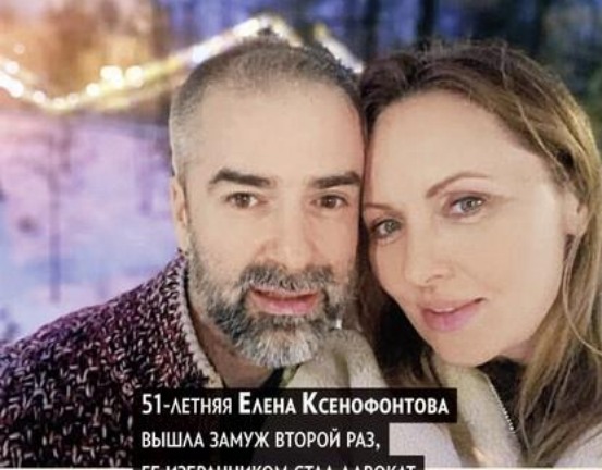
51-летняя Елена Ксенофонтова вышла замуж второй раз, ее избранником стал адвокат Алексей Куликов .