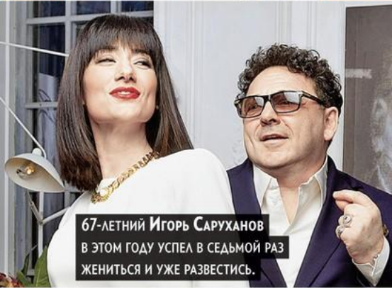
67-летний Игорь Саруханов в этом году успел в седьмой раз жениться и уже развестись.