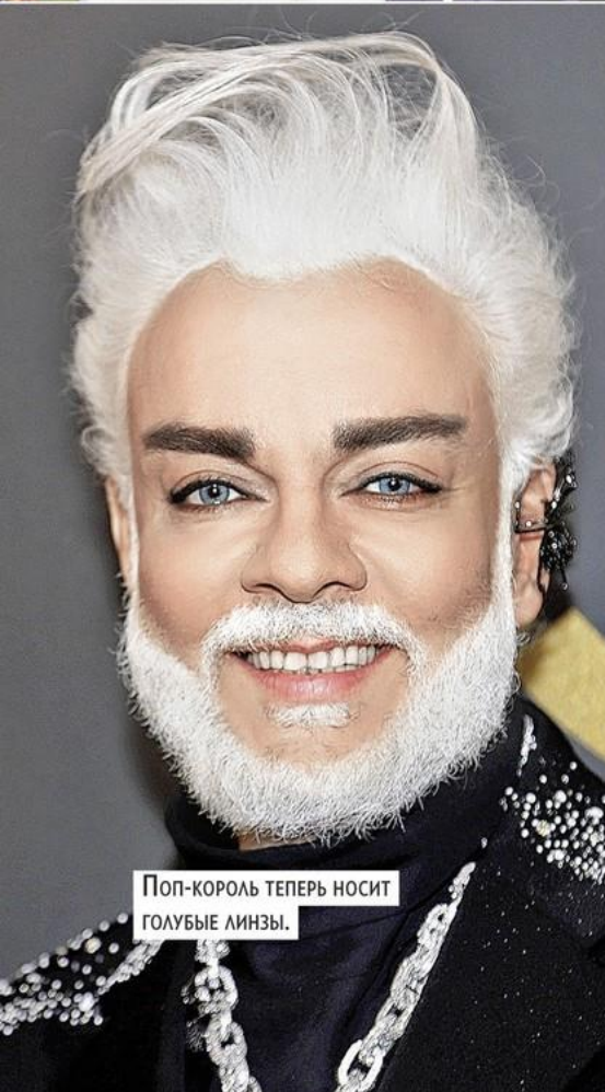
Поп-король теперь носит голубые линзы.