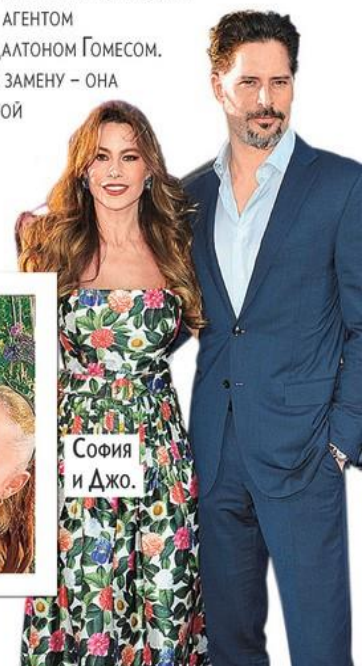
СОФИЯ И ДЖО.