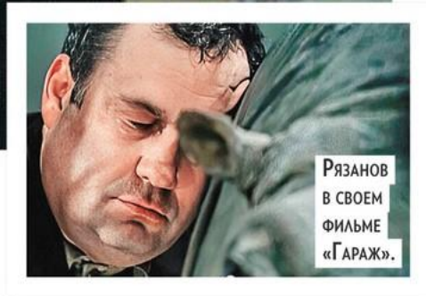
РЯЗАНОВ В СВОЕМ ФИЛЬМЕ «ГАРАЖ».

над реальностью, как и я. Сатирик – это тот, кто клеймит других, а чтобы быть таковым, надо быть уверенным в собственной непогрешимости. Поэтому в своих работах мы шутили только над собой. Правда, Гайдаю не нравилось, когда смеялись во время съемочного процесса. Он говорил: «Если на площадке хохочут, зритель в зале на этом эпизоде смеяться не будет, а когда наоборот, все дается кровью, есть надежда, что зал будет смеяться».