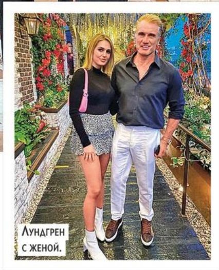
ЛУНДГРЕН С ЖЕНОЙ.