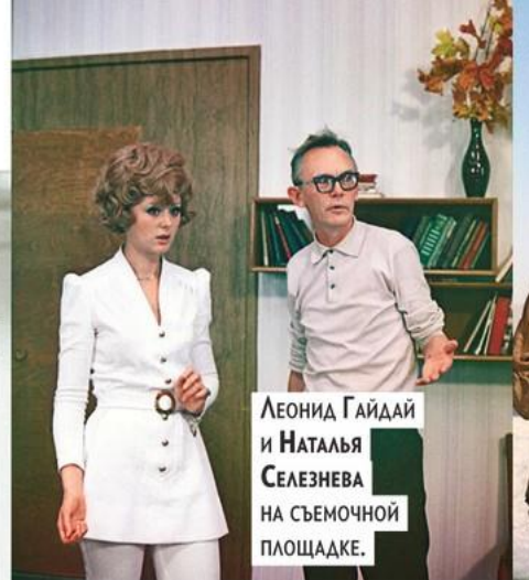
ЛЕОНИД ГАЙДАЙ И НАТАЛЬЯ СЕЛЕЗНЕВА НА СЪЕМОЧНОЙ ПЛОЩАДКЕ.

Он снимался и сам в своих картинах в эпизодических ролях: гражданин