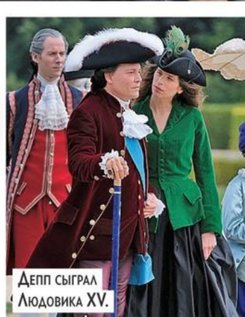
Депп сыграл Людовика XV.

ня 2022 года, тогда жюри присяжных признало Херд виновной. Как только Джонни оправдали, актриса и режиссер Майвенн Ле Беско позвала его на главную роль в свою картину «Жанна Дюбарри». На красной дорожке в Каннах коллеги появились вместе. После премьеры фильма зал в течение семи минут аплодировал Деппу, а 59-летний актер не сдерживал слез счастья. Еще одной приятной новостью для Джонни стал новый контракт с брендом Dior. Даже во время скандального развода Депп продолжал быть лицом их аромата. Сейчас же с актером подписали соглашение на $20 млн. Эта сумма стала рекордной в истории рекламы мужской парфюмерии.