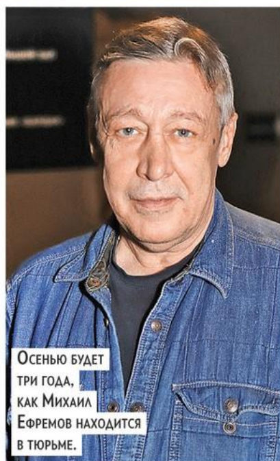
Осенью будет три года, как Михаил Ефремов находится в тюрьме.