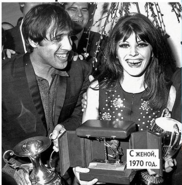
С женой, 1970 год.