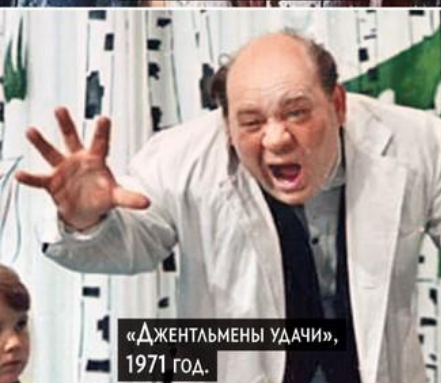
«Джентльмены удачи», 1971 год.