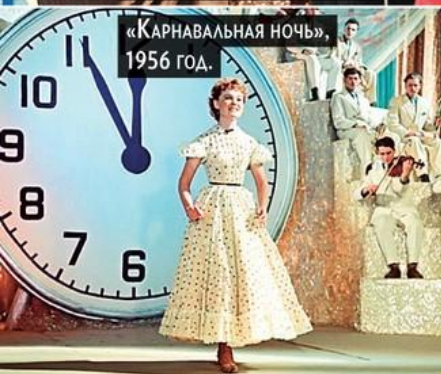
«Карнавальная ночь», 1956 год.