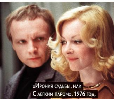
«Ирония судьбы, или С легким паром», 1976 год.