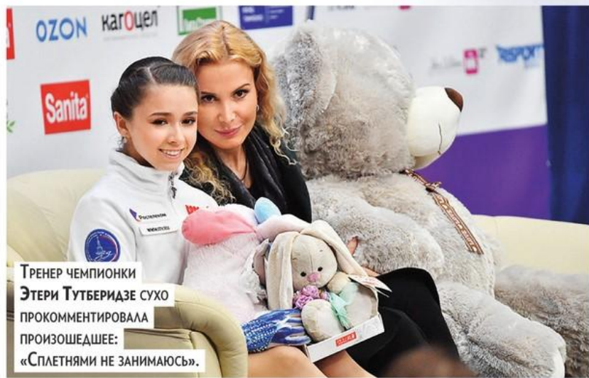
Трениер чемпионки ЭТЕРИ ТУТБЕРИДЗЕ СУХО ПРОКОММЕНТИРОВАЛА ПРОИЗОШЕДШЕЕ: «СПЛЕТНЯМИ НЕ ЗАНИМАЮСЬ».

Наша талантливая фигуристка КАМИЛА ВАЛИЕВА попала в допинг-скандал на Олимпиаде в Пекине. Правда ли это или провокация? «Антенна» разбирается с экспертами.