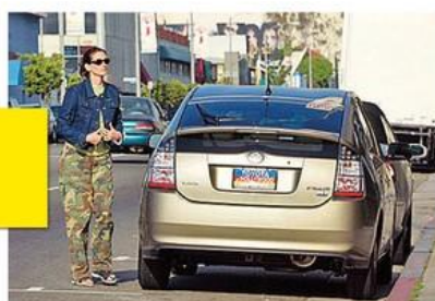
Toyota Prius $30 тыс.

Если на недвижимость Джулия денег не жалеет, то машины выбирает скромные и экономичные. Вот уже несколько лет она ездит на электромобиле Toyota Prius. «Каждый человек может внести свой вклад в лучшее и безопасное будущее», – считает актриса.