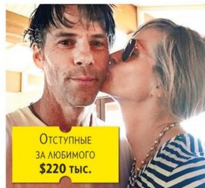
Отступные за любимого $220 тыс.