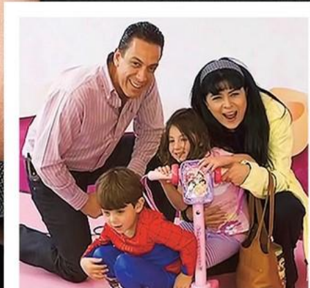
ВТОРОМУ СУПРУГУ ОМАРУ ФАЙЯДУ ВИКТОРИЯ РОДИЛА БЛИЗНЕЦОВ: МАЛЬЧИКА АНУАРА И ДЕВОЧКУ, КОТОРУЮ НАЗВАЛА В ЧЕСТЬ СЕБЯ.