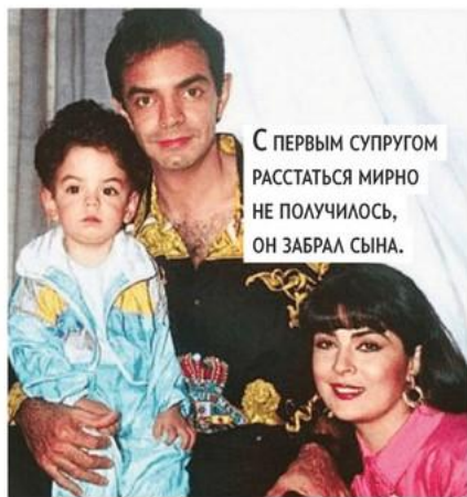
С ПЕРВЫМ СУПРУГОМ РАССТАТЬСЯ МИРНО НЕ ПОЛУЧИЛОСЬ, ОН ЗАБРАЛ СЫНА.