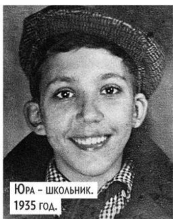
Юра - школьник. 1935 год.

СВОЮ КАРЬЕРУ В ЦИРКЕ АРТИСТ НАЧАЛ В 1947 ГОДУ «С ПОДСАДКИ». ОН БЫЛ ТЕМ ЗРИТЕЛЕМ, КОТОРОГО ЯКОБЫ СЛУЧАЙНО ЗАДЕЙСТВОВАЛИ В ПРЕДСТАВЛЕНИИ: ОН ЯКОБЫ ВПЕРВЫЕ СЕЛ НА ЛОШАДЬ.