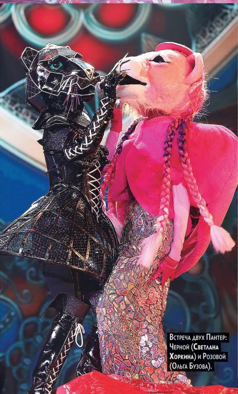
Встреча двух Пантер: Черной (Светлана Хоркина) и Розовой (Ольга Бузова).

Мастера проекта почти полгода трудились над созданием масок. Одним из самых сложных стал образ Елочной Игрушки. На него ушло более 800 новогодних шаров, костюм в итоге весит около 35 кг! Непросто придется и артисту, выступающему в роли Ежика, ведь за происходящим в зале он наблюдает даже не через прорези для глаз, а с помощью встроенных в маску камер и экранов.