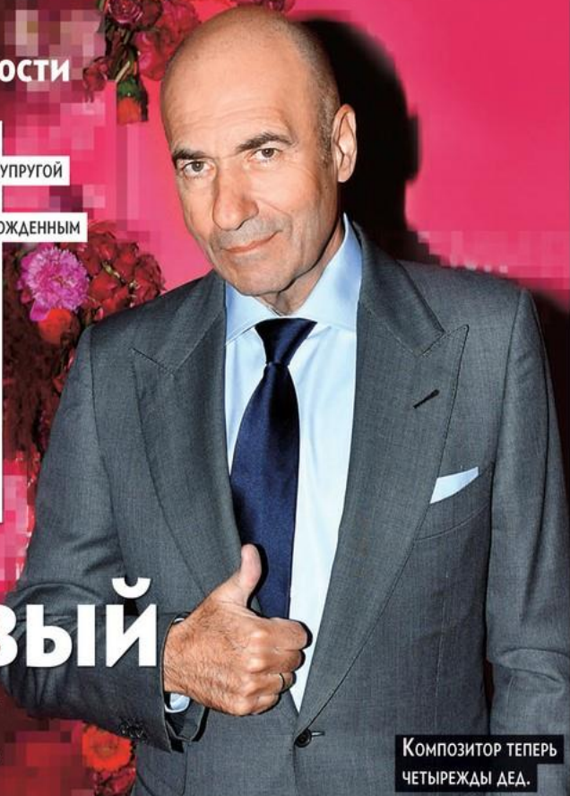
Композитор теперь четырежды дед.