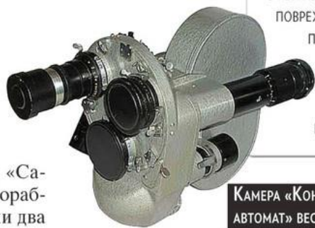
КАМЕРА «КОНВАС-АВТОМАТ» ВЕСИТ 5,7 КГ.

Эту работу на станции «Салют-7» и космическом корабле «Союз Т-9» проводили два летчика-космонавта. Дважды Герой Советского Союза Владимир Ляхов скончался в 2018 году в возрасте 76 лет. Его напарник, дважды Герой Советского Союза Александр Александров, в свои 78 лет работает советником генерального директора Ракетно-космической корпорации «Энергия» имени С.П. Королева – это головная организация по пилотируемым космическим системам. – Пуск назначили на июнь 1983 года, – вспоминает Александр Павлович. –