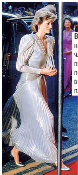
В 1985 году на премьере новой части Бондианы Принцесса Диана появилась в «драгоценном» платье.