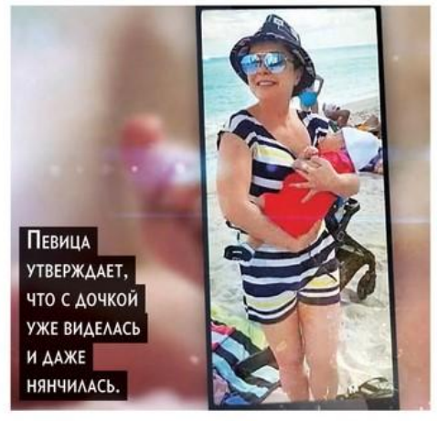
ПЕВИЦА УТВЕРЖДАЕТ, ЧТО С ДОЧКОЙ УЖЕ ВИДЕЛАСЬ И ДАЖЕ НЯНЧИЛАСЬ.

– Моя дочь родилась от другого мужчины. Я осуществила мечту очень хорошего человека, моего друга. И сделала ему подарок в виде прекрасной девочки. Я подарила ему свою яйцеклетку.