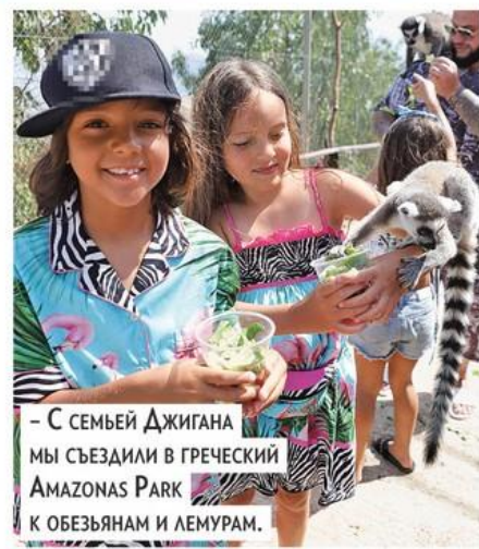
– С семьей Джиганы мы съездили в греческий Amazonas Park к обезьянам и лемурам.

Бить посуду в Греции, рыбачить на Белом море