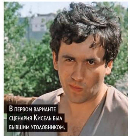
В ПЕРВОМ ВАРИАНТЕ СЦЕНАРИЯ КИСЕЛЬ БЫЛ БЫВШИМ УГОЛОВНИКОМ.

Натурные съемки проходили в Петропавловской крепости и в московской усадьбе «Братцево». Одной из главных трудностей стал пошив гусарской формы. Консультант картины сделал подробную таблицу: где какие знаки различия, пуговицы, шитье на воротнике. В последний момент Рязанов изменил финал, показав разжалованного в рядовые Плетнева. Костюм срочно поменяли, в результате чего оказались коротковаты рукава, но режиссер был доволен.