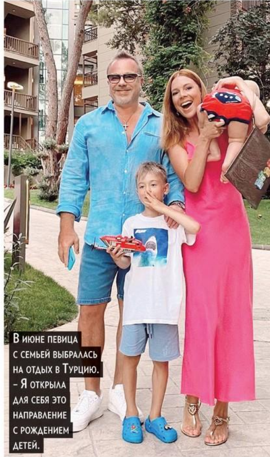
В июне певица с семьей выбралась на отдых в Турцию. – Я открыла для себя это направление с рождением детей.

– Для многих ваших поклонников шоком стало то, как быстро вы вернулись в форму после родов! Младшему сыну ведь и года нет, а вы уже можете позволить себе надеть бикини на пляже.