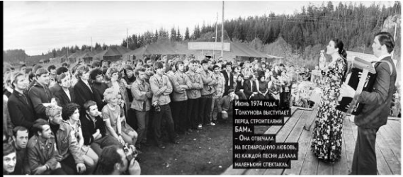
Июль 1974 года. Толкунова выступает перед строителями БАМ. – Она отвечала на всепродуманные вопросы журналистов из каждой песни. Делала выразительные жесты.