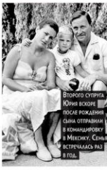
Второго супруга Юрия в конце после рождения сына отправил в командировку в Мексику. Сын встретился с ней в 2003 году.

Умерла: 22 марта 2010 года в Москве. Похоронена на Троекуровском кладбище.