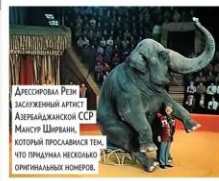
Дрессировка Рези заслуженный артист Азербайджанской ССР Мансур Шейванли, который прославился тем, что прыгнул несомоюо оригинальные номера.

Актер - слон Бобо По сюжету пятилетний мальчик Боба проводит время в зоопарке, где его мама продает мороженое. Там он подружился со слонами. Когда вечером посетителя расколотся, слон отправляется искать своего маленького друга в город, вызывая своим появлением смеление у жителей.