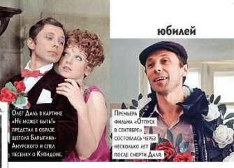
ОЛЕГ ДАЛЬ В КАРТИНЕ «НЕ МОЖЕТ БЫТЬ ПРИДАТА В ОБРАТЕ ПИТЕРА ВАРВИЛЛА» АНУШКОГО И СПЕЛ ПЕССИМУ О КУПЦАХ.