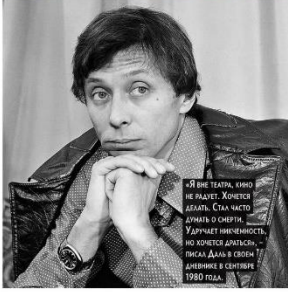
«Я не актер, кино не играет. Хочется играть. Стал часто думать о смерти. Утром выключился, писал Даль в своем дневнике в сентябре 1980 года».

«Все понимали его потенциал, но мало кто хотел сблизиться с этой пропастью», — вспоминают друзья и коллеги накануне 80-летнего юбилея актера.