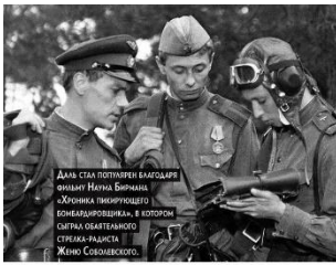
ДАЛЬ СНА ПОДПИСАН БЛАГОДАРИ ОФИЦЕРА НАУМА БИРМАНА («Золотая минута») БОМБАРДИРОВЩИКА, В КОТОРОМ СЫГРАЛ ОБАТЕНАТОГО СТЕПКА-РАКЕТСА ЖИЖО СЕРГЕЕВИЧА.