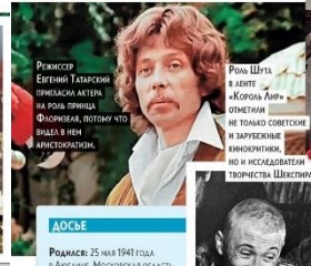
РЕЖИССЕР ЕВГЕНИЙ ТАТЯРСКИЙ ПРИГЛАШАЕТ АКТЕРА НА РОЛЬ ПРИНЦА ФЛОРИДАНА, ПОТОМУ ЧТО БРАДА В ЧЕМ-ТО НАПОМИНАЕТ ЕГО И ИСПОЛНЕНИЕ ТВОРЧЕСТВА ШЕКСПИРА.