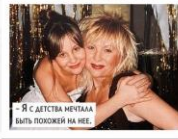
— Я с детства мечтаю быть похожей на нее.

с кого-либо! Она правда была ко мне строже, чем к остальным, но понимаю почему. Мы же все хотим, чтобы наши дети были лучше, чем мы, вот и мама старалась выжать из дочки все хорошее максимально. Я считаю, что, когда родитель — твой педагог, это здорово, потому что ты правду, которую скажет он, тебе так не озвучит никто, к тому же такой профессионал с большой буквы. Мама заложила в меня все то, что было у нее самой, стремилась, чтобы я все делала филигранно и идеально. В итоге я окончила не только Академию имени Гнесиных, но и Институт современного искусства и владею профессией эстрадно-джазового вокалистки.